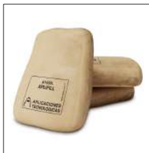
AT-032L APLIFILL 25 kg