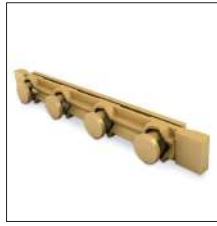
AT-020H Puente comprobación latón para arqueta