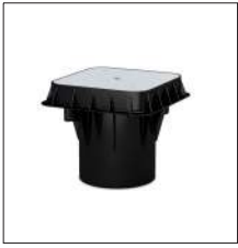
AT-010H Arqueta de polipropileno de 250 x 250 x 250 mm