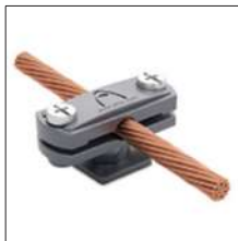
AT-030E Grapa nylon cable/plet. Elevación 17mm