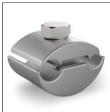
AT-013F Manguito bimetálico para cable 25-150mm 2