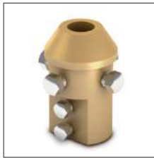
AT-011A Pieza adaptación latón mástil 1½" baj int cable-pletina